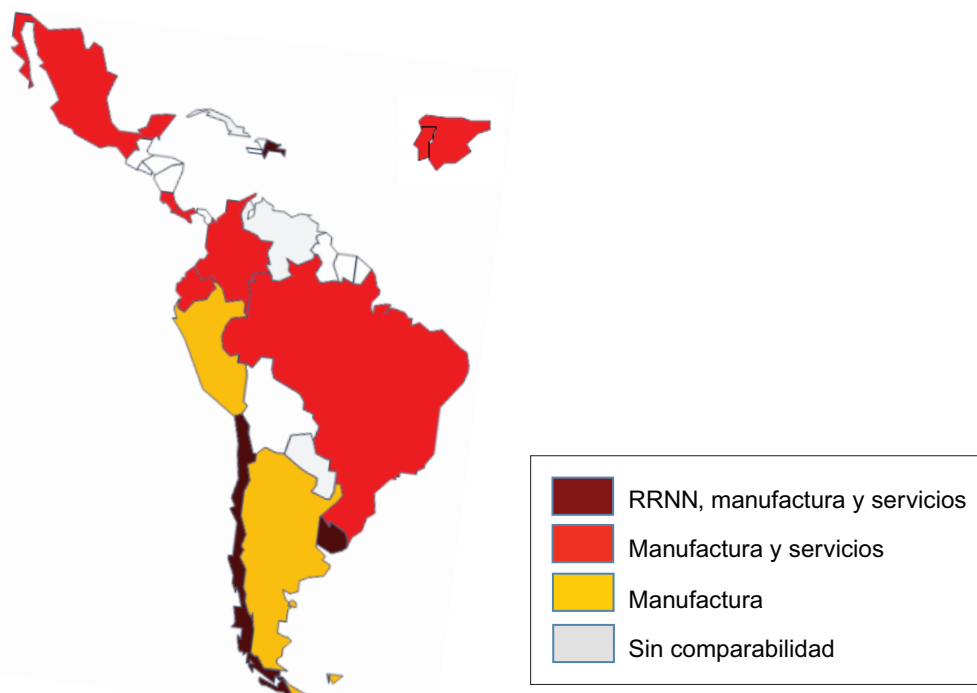
Figura 2. Cobertura sectorial

En relación a los servicios, la mayoría de los países ha aplicado el mismo formulario que en manufactura, incluso aquellos países donde los ejercicios se llevan de manera separada (uno para manufactura y uno para servicios). Desde una perspectiva teórica, esto implica que se ha seguido un criterio asimilacionista que sostiene, de manera simplificada, que el proceso de innovación en la industria manufacturera y en el sector servicios puede ser capturado a partir de los mismos indicadores (Barletta et al., 2013). Como resultado, la comparabilidad de los indicadores al interior de cada país es perfecta, lo mismo en el plano internacional, en la medida que se utilicen formularios similares. No obstante, y siguiendo lo